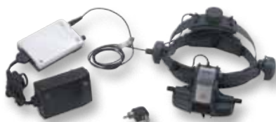
[ 03 ]