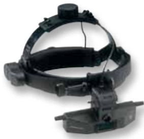
SIGMA 150 K на шлеме

SIGMA 150K M2 как основа непрямого офтальмоскопа; крепление на шлем с мягкими подушечками; регулировка по высоте и ширине шлема; без реостата на шлеме; с точечной апертурой