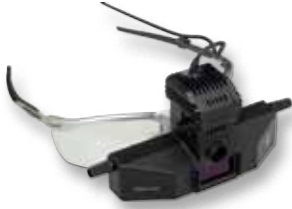
SIGMA 150 с S-Frame