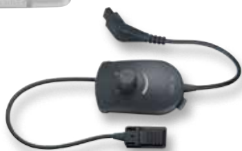
[ 02 ]