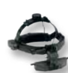
SIGMA 150 K 150 K 150 K/M2